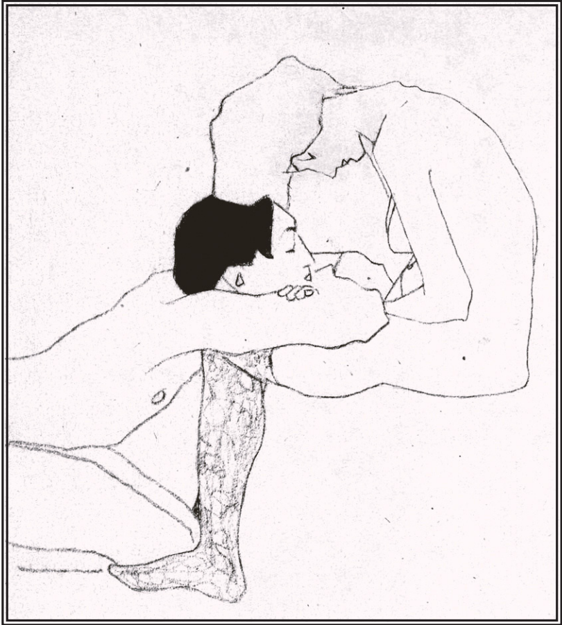
egon schiele, lovers