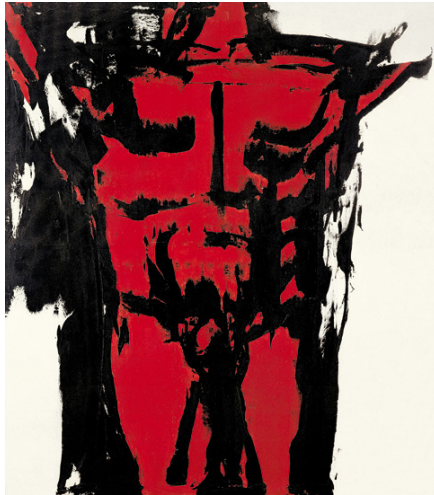
judit reigl, homme