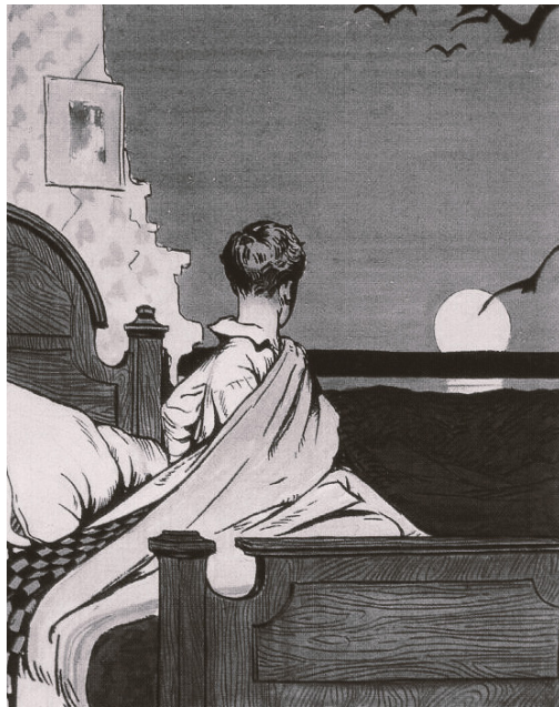
edward hopper, boy and the moon

είκοσι οκτώ αντισίξεις είκοσι οκτώ αντιστάσεις